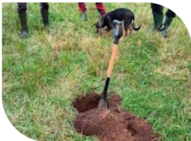
Fältvandring i Kronoberg med tema Jordhälsa i praktiken.