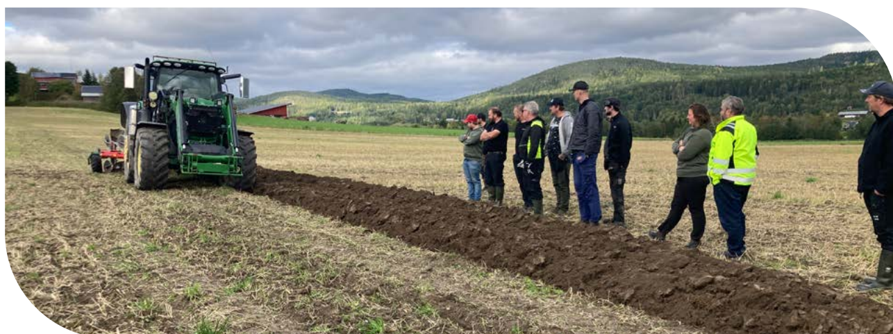
Välbesökta kursdagar i plöjning där ett 30-tal lantbrukare i Västernorrland fick lära sig allt om att ställa in plogen och få till en snygg tilta som skapar grunden för en god växtodling.